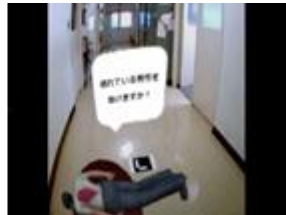
(c) 負傷者の AR