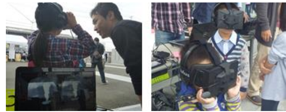
図 3 派生システム利用時の様子

エレベータ: 避難訓練参加者は選択肢マーカを 3 秒間見続けることで、エレベータを使用して避難するか選択