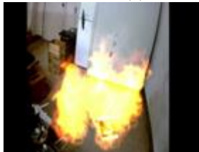
(b) 火災の AR