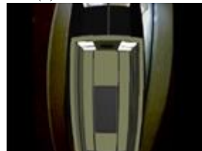
(d-2) エレベータの落下